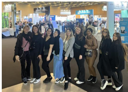
Voyage scolaire Barcelone 2024