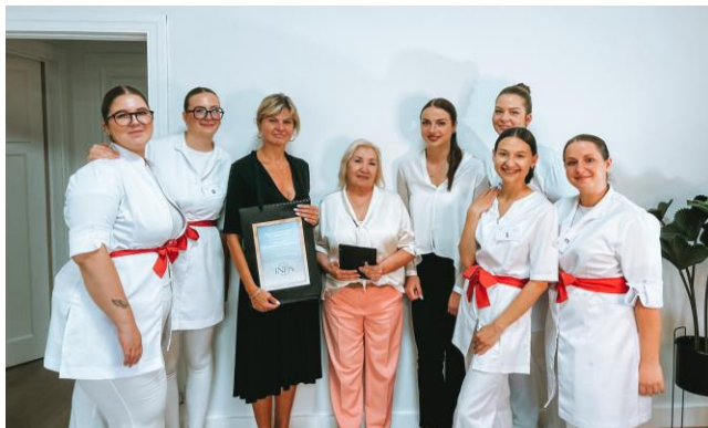
Jury international INFA en examination à la F.I.E

(Fédération Internationale de l'Esthétique-Cosmétique)