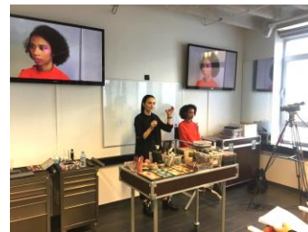
Journée Maquillage Chez Make Up For Ever