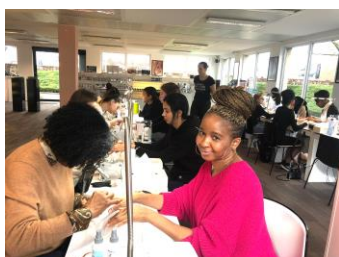
Journée Onglerie Chez Pronails