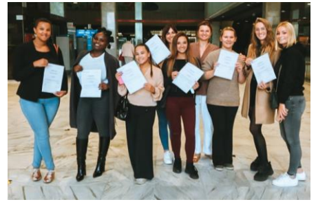
Jury central de Bruxelles pour l'accès à la profession en esthétique. La F.I.E accompagne ses élèves.