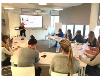
Journée Soin Visage Chez Maria Galland