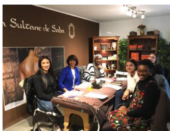
Journée Soin Corps Chez La Sultane de Saba